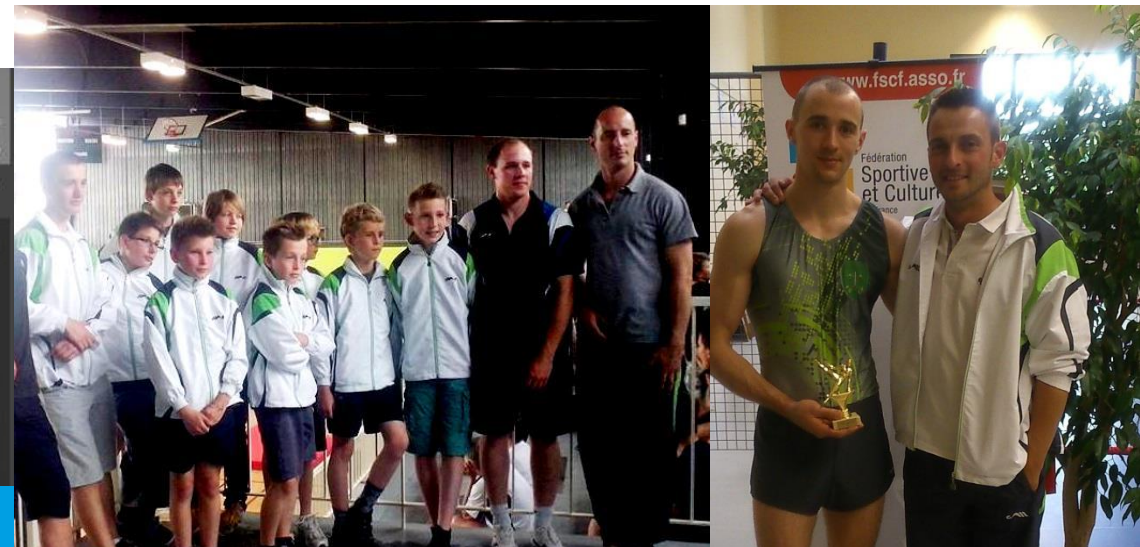
Equipe pupilles Fédéral 3 2014 Audincourt

Axe A18 : Travailler à la reconnaissance de notre structure au niveau de la communauté d'Agglomération.